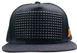
イタリアンテイスト フリーサイズ スナップバックキャップ